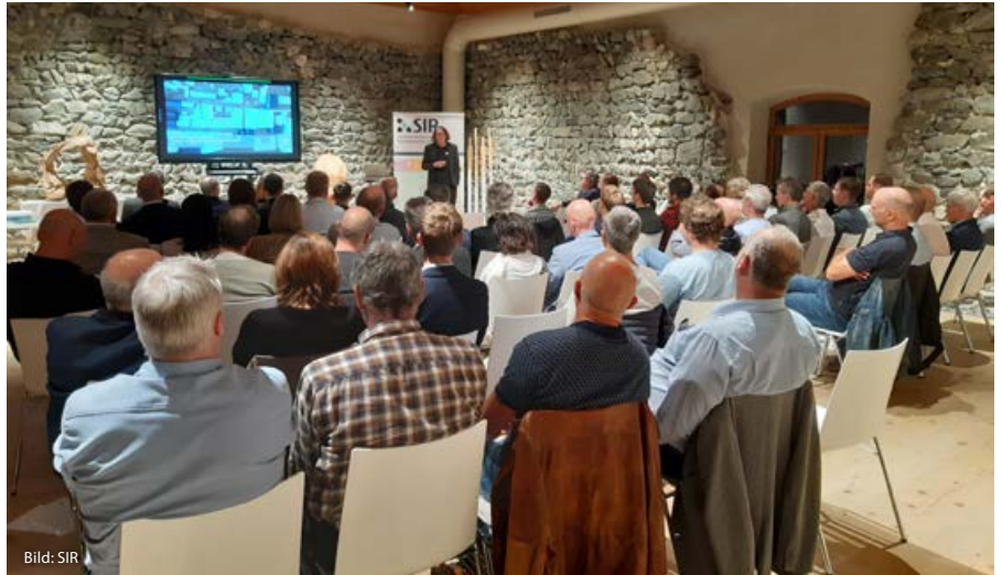
Viele Teilnehmer bei der Werkstatt "Attraktives Wohnen: bodensparend & leistungsfähig"

Rund 60 Entscheidungsträger und Stakeholder, darunter viele Bürgermeister und Bauträger sowie Landesrat Zauner sind der Einladung gefolgt und haben sich bei der Werkstatt „Attraktives Wohnen: bodensparend & leistungsfähig“ mit diesem in vielen Gemeinden „heißen“ Thema beschäftigt. Impulsreferate lieferten den fachlichen Input, versuchten zu sensibilisieren sowie Alternativen und Chancen für eine nachhaltige Siedlungsentwicklung aufzuzeigen. Die Vorstellung gelungener Beispiele und Möglichkeiten in der Siedlungsentwick-