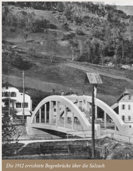
Die 1912 errichtete Bogenbrücke über die Salzach

Ein gutes Jahrzehnt später wurde im Jahr 1912 die Salzachbrücke neu errichtet. „Salzachbrücke im Markte Mittersill über die Salzach aus Beton erbaut“, vermerkte der Chronist in der Mittersiller Gendarmen-chronik. Gut 50 Jahre sollte diese Bogenbrücke über die Salzach halten. Die älteren Bürger Mittersills werden sich ja noch gut daran erinnern. Im Jahr 1963 wurde schließlich die heutige Brücke errichtet. Damals vorausschauend ein Segen für den stärker werdenden Autoverkehr, bis heute allerdings eine große Gefahrenstelle für die Stadt in einem – hoffentlich nicht – zukünftigen Hochwasserereignis. Der in Aussicht gestellte Bau einer neuen Brücke – dieses Mal als „Hubbrücke“ – soll diese Gefährdung für unsere Stadt hintanhalten.