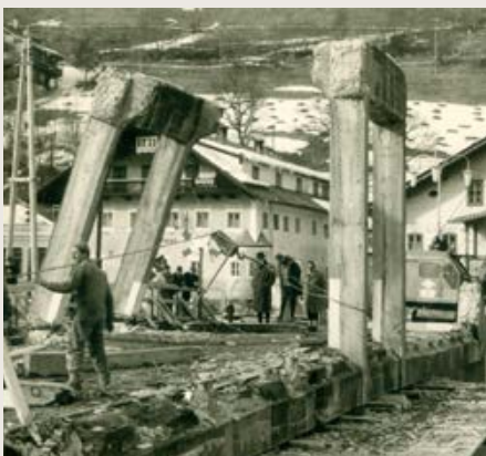
Abriss der alten und Bau der heutigen Salzachbrücke 1963

Für das oben Gesagte wirft sich die Frage auf, ob und in welcher Art der Bürgerwald – seit vielen Jahrhunderten in Notsituationen für die Marktbürger gesichert – auch in Zukunft als „Schutzwald“ für unsere Stadt dienen kann.